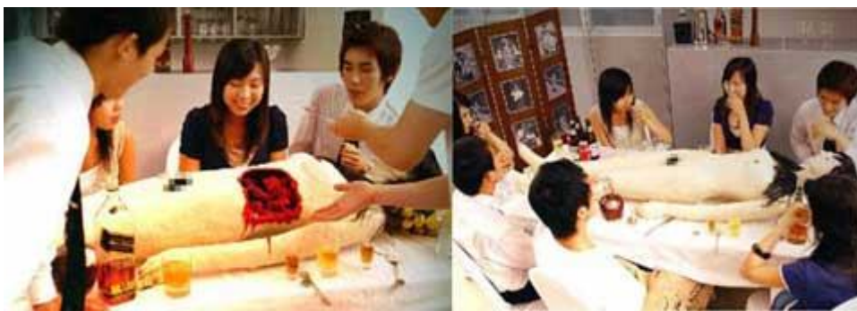
Рисунок 10.1 – Подання страви у ресторані «Food-O-Rama» (Японія)

До зали на лікарняному візку ввозиться тіло, котре офіціант-хірург у присутності відвідувачів починає препарувати та розкладати на тарілки (рис. 10.1).