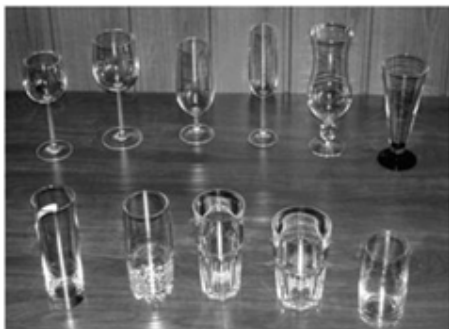
Рисунок 11.3 – Скляний посуд для подавання напоїв: а - конічні і циліндричні стакани; б – келихи

Напої подають у різноманітному посуді (рис. 11.3, 11.4): вина, коньяки і шампанське – у відповідних чарках і келихах; коктейлі – у склянках місткістю 75-125 мл; тонізуючі та прохолодні змішані напої – у конічних або циліндричних стаканах місткістю 250-300 мл; крешони, пунші, глінтвейни і гроги – в чашках місткістю 100-150 мл.