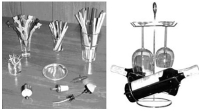
Рисунок 11.2 – Сучасні аксесуари та прикраси для барів

Для вишень і слив, якими прикрашають коктейлі, а також для канапе використовують шпажки, для змішаних напоїв – соломки різного діаметра, палички для розмішування коктейлів, прикраси для коктейлів і десертів. Крім того, у барі мають бути сифони для приготування газованої води, підставки для серветок, таці, лійки, ложка для морозива, ступка з товкачем, столові набори - різноманітні щипці (для льоду, цукру, кондитерських виробів, бутербродів), чайні і кавові ложки, виделки для лимонів, десертні ножі, кондитерські лопатки, зубочистки в індивідуальній упаковці, палички для барбекю, свічки, серветки.