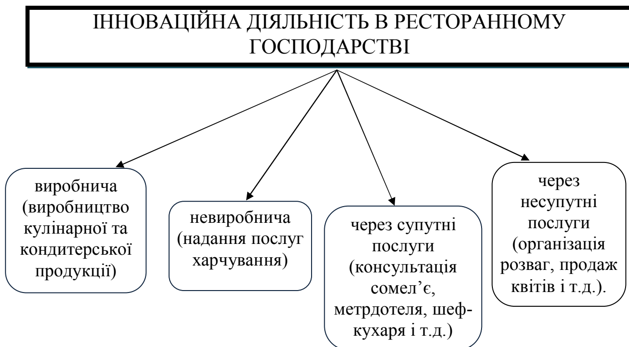
Рисунок 7.1 – Види інноваційної діяльності в ресторанному господарстві

Інноваційна діяльність в ресторанному господарстві може бути охарактеризована: - як виробнича (виробництво кулінарної та кондитерської продукції); - як невиробнича (надання послуг харчування); - через супутні послуги (консультація сомел'є, метрдотеля, шеф-кухаря і т.д.); - через несупутні послуги (організація розваг, продаж квітів і т.д.).