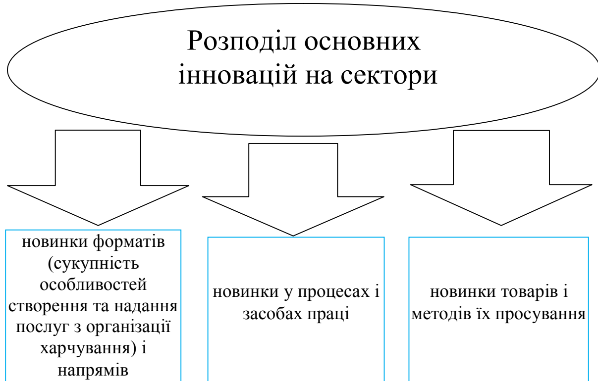
Рисунок 7.2 – Розподіл основних інновацій на сектори

зкладах - змішаний, особлива увага приділяється способу приготування. У стравах підкреслюється натуральність продукту, зменшується додаткова обробка інгредієнтів. Перспективними підприємствами харчування можуть стати заклади, які обслуговували б спальні райони, так звані «ресторани однієї вулиці». Кейтеринг і доставка страв в офіс практично знаходиться на стадії зародження і має простір для розвитку.