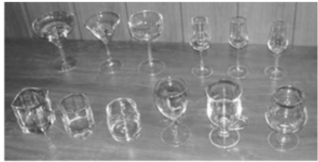
Рисунок 11.4 – Скляний посуд для міцних коктейлів

Для відпускання соків, мінеральної води та інших безалкогольних газованих напоїв з льодом використовують скляний посуд місткістю 150-200 мл.