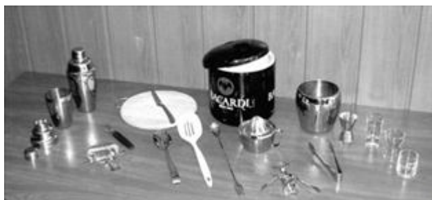
Рисунок 11.1 – Барний інвентар та інструменти (зліва направо в першому ряду - шейкери, в другому - стрейнер, інструмент для відкорковування пляшок, дошка і ніж для нарізання лимона; в третьому ряду - ложки для перемішування напоїв, пристрій для вичавлювання натурального соку, пластмасова і металева ємності для льоду, в четвертому - комбінований інструмент для відкорковування пляшок, щипці для льоду, мірний посуд)

Для приготування змішаних напоїв використовують барний інвентар та інструмент (рис. 11.1).